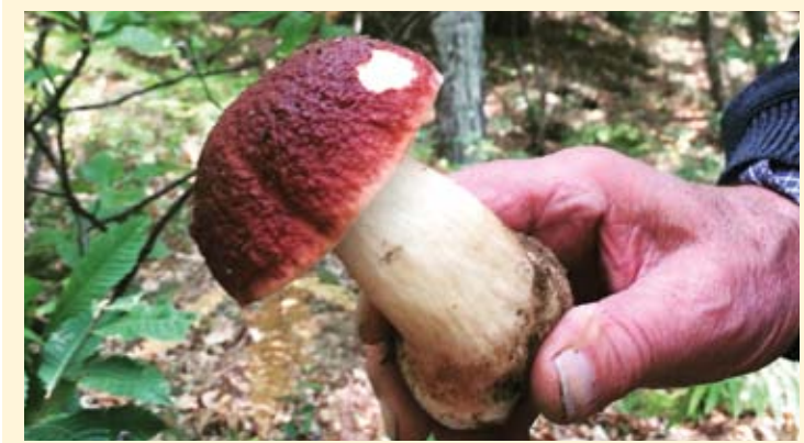
Il fungo porcino di Borgotaro IGP

Fra i borghi storici di sicuro merita una visita quello di Compiano, borgo medievale ancora cinto da mura, dominato dal grande castello che fu dominio dei Landi, e più recentemente della Marchesa Raimondi Gambarotta ( www.castellodcompiano.com ). Sia Bedonia che Borgotaro conservano colorati centri storici con chiese e monumenti importanti, fra cui l'imponente polo museale del Seminario Vescovile di Bedonia (planetario, quadreria, biblioteca antica, museo archeologico e di storia naturale). A Tarsogno il piccolo museo dell'Emigrante, con video, foto e cimeli dell'epoca dell'emigrazione valtarese nel mondo.