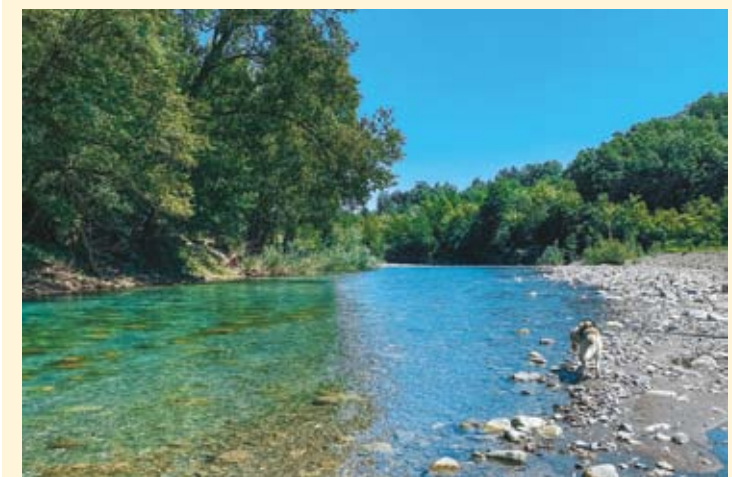
Un tratto del fiume Taro

Terra di emigrazione, l'Alta Valtaro ha ancora grandi comunità all'estero (Londra e New York in particolare) ancora molto legate al territorio.