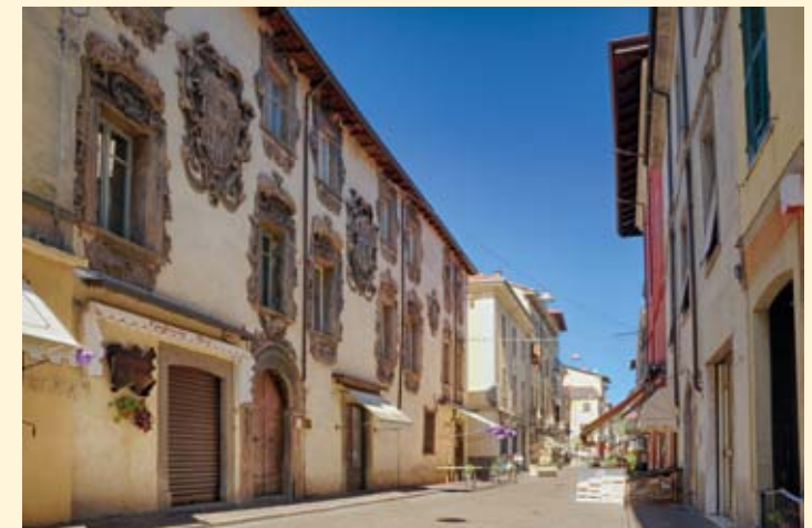
Palazzi storici nel centro di Borgo Val di Taro

Land of emigration, Valtaro still has large communities abroad (London and New York in particular) very tied to the territory.